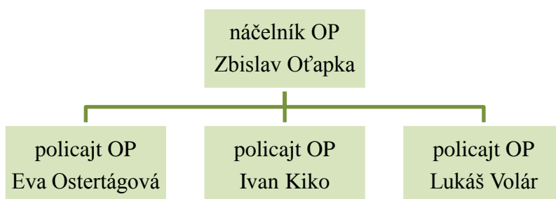
Obr. 1 Organizačná štruktúra Obecnej polície Lužianky

V zmysle platného organizačného poriadku OP boli pracovné zmeny vykonávané v popoludňajších hodinách v čase od 14.00 do 22.00 hod. a od 16.00 do 24.00 hod., v nočných hodinách od 18.00 do 02.00 hod. a 20.00 do 04.00 hod., v denných službách a v dňoch vyplácania sociálnych dávok od 07.00 do 15.00 a od 9.00 do 17.00 hod. Na základe toho, bolo denné pokrytie službami v počte 15 hodín, v závislosti od potreby a situácie.